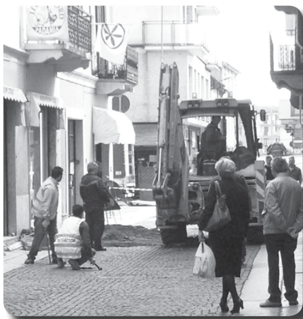
I lavori in corso nella zona