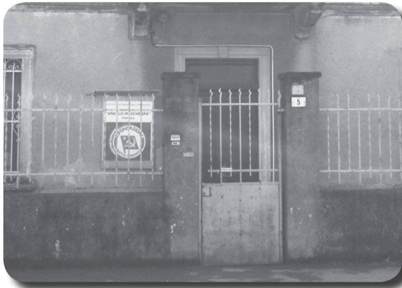
La sede del circolo Angelo Mascherpa, al 5 di via Cadorna